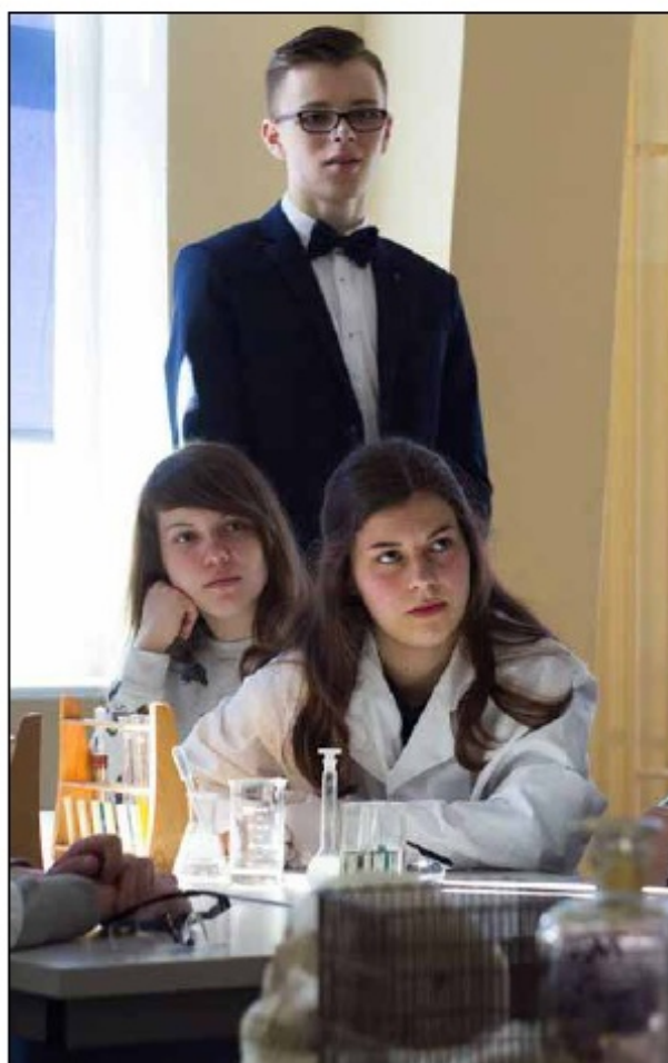
Warsztaty chemiczne, 2015 r.

W szkole zawsze dużo się działo. Na przykład „akcje”, na które autentycznie czekało się z niecierpliwością! Taki jest coroczny Dzień Kota, podczas którego „pierwszaki” mają szansę lepiej poznać siebie, szkołę i inne klasy, jednocześnie biorąc udział w zwariowanych konkurencjach organizowanych przez klasy trzecie. Szczególny jest listopadowy Dzień Języków Obcych, kiedy każda klasa przygotowuje stoisko prezentujące kulturę, historię (i kuchnię!) danego kraju. W mojej pamięci utkwiły też słynne już Koncerty Walentynkowe, które nie są