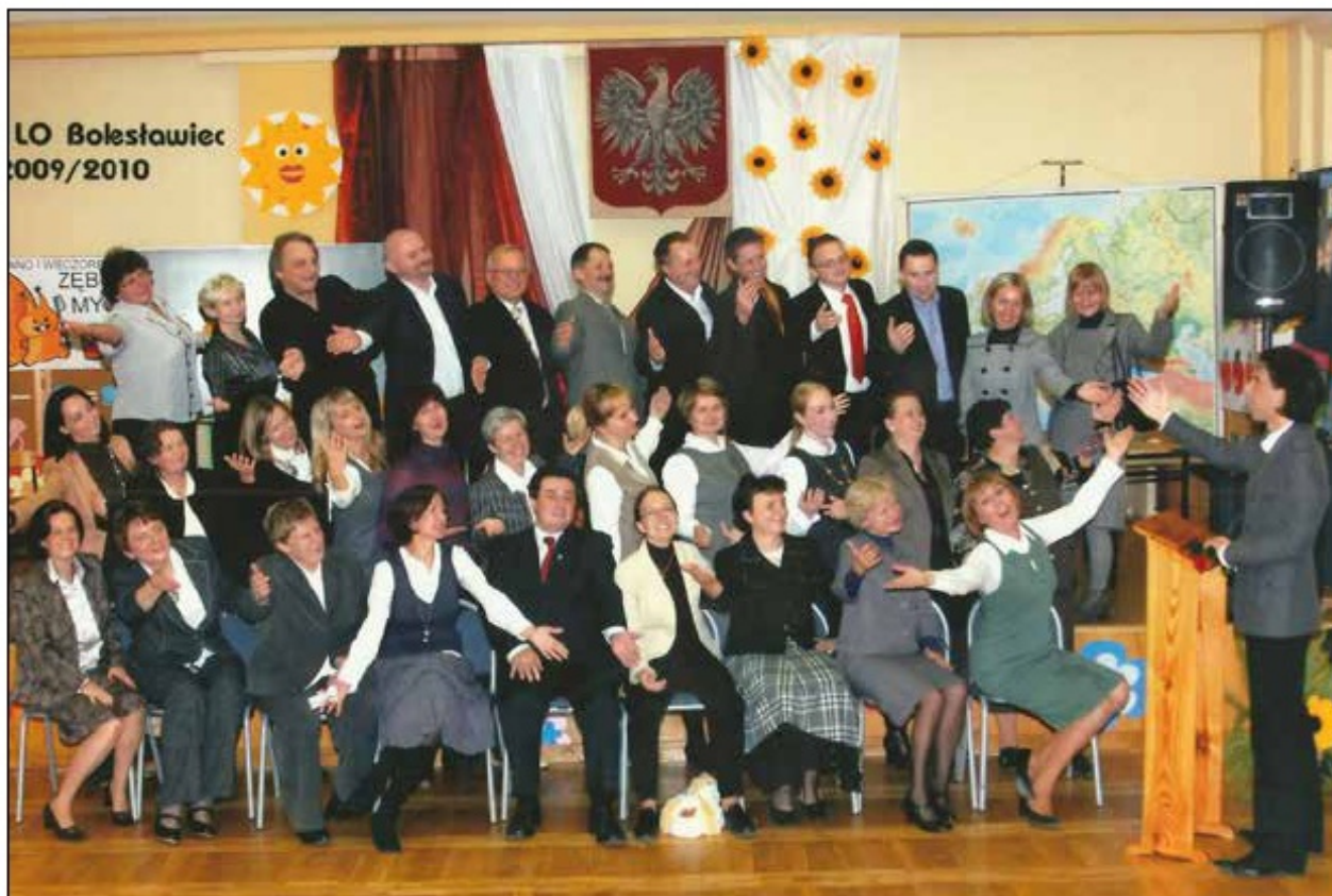
Grono Pedagogiczne 2009/2010