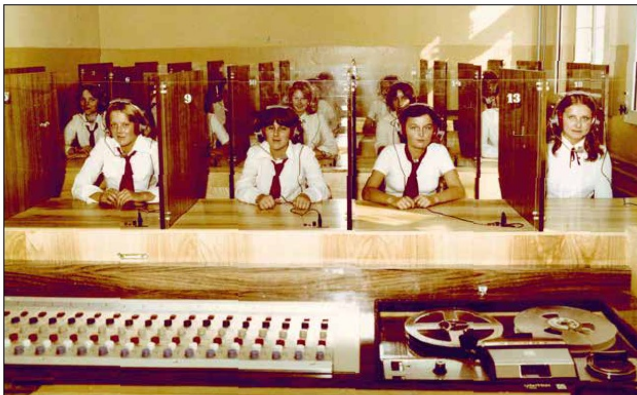
Zajęcia w pracowni językowej, 1978/79 r.

było możliwe dzięki wsparciu Kuratorium Oświaty i Wychowania w Jeleniej Górze, które przekazało szkole auto marki fiat 126p.