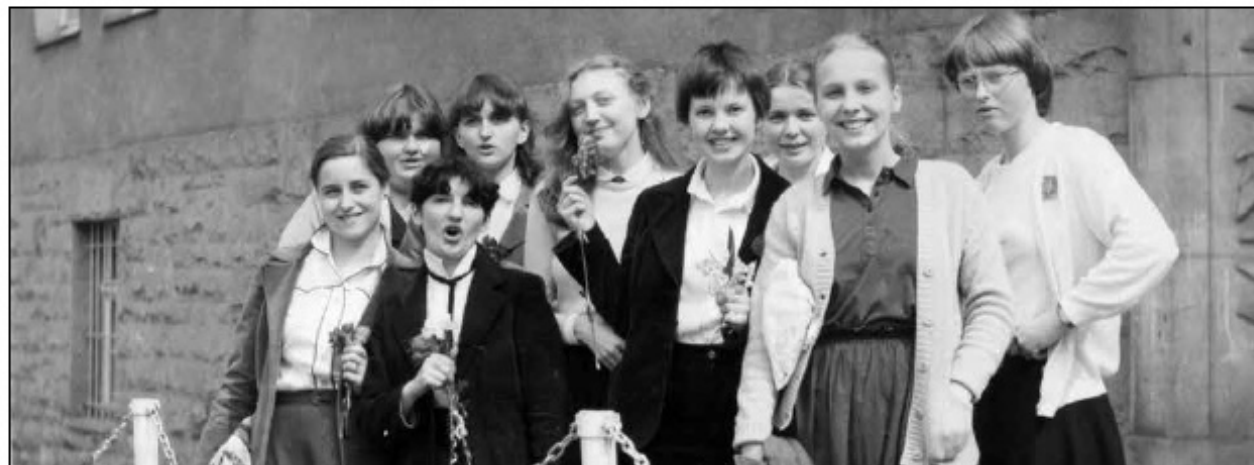
Maturzystki, 1980 r.

Tamtego liceum już nie ma. Wiem, że spostrzeżenie takie ociera się o banał, skoro szkołę tworzyły składniki niepowtarzalne: określony czas, ludzie, klimat. Ale jednocześnie wciąż jest - ta sama, choć nie taka sama. I inaczej być nie może, skoro ma się rozwijać i nadać za wyzwaniem swojego czasu. Zatem dobrze, że jest. A skoro z radością to zauważam, pozostaje wyrazić serdeczne życzenie, aby stwierdzenie takie nigdy nie straciło na aktualności.