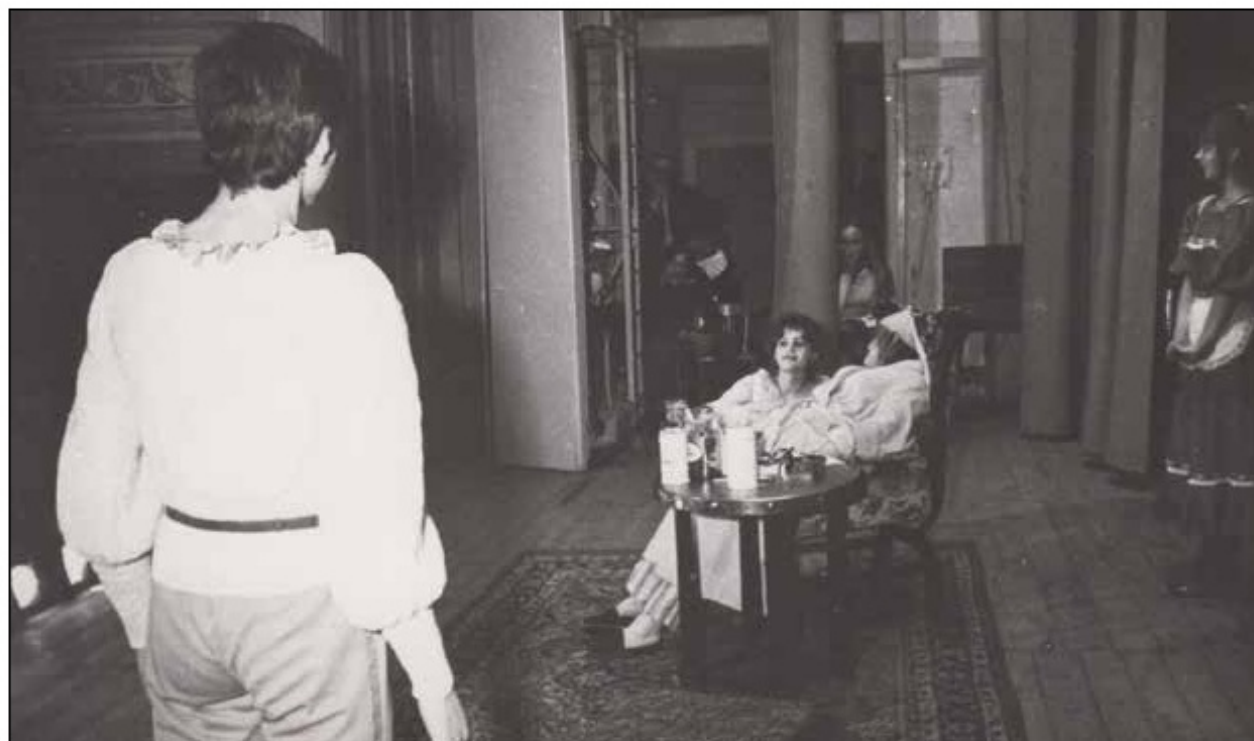
Scena ze spektaklu „Chory z urojenia”, Teatr Stary w Bolesławcu, rok szkolny 1975/1976