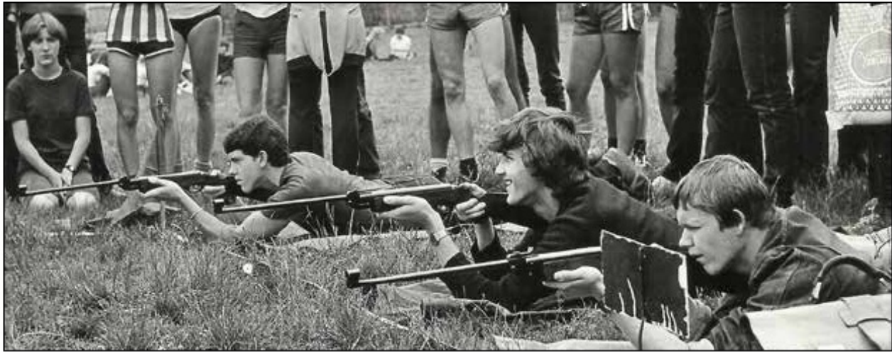
Szkolne zawody strzeleckie, 1981 r.

miejsce w ówczesnym województwie jeleniogórskim. Rozgrywaliśmy także wiele spotkań towarzyskich z wojskiem, nauczycielami i zaprzyjaźnionymi szkołami.