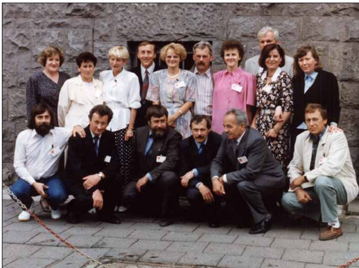
Spotkanie absolwentów rocznika 1968 z okazji 25-lecia matury, 1993 r.