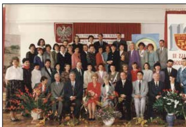
III Zjazd Absolwentów z okazji jubileuszu 50-lecia istnienia I LO, 1996 r.