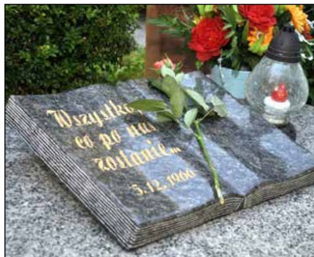
Księga na grobie H. i W. Tyrankiewiczów