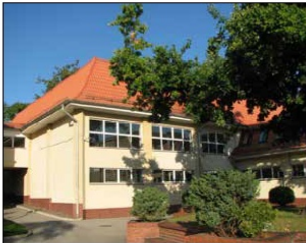
Hala sportowa, widok współczesny

kę szkolną, położono parkiet i marmurową posadzkę na parterze, zamontowano boazerie na ścianach korytarzy, wykonano nowe pokrycie dachu. Największą inwestycją, którą próbowano podjąć przez kilkadziesiąt lat, było wybudowanie hali sportowej - uroczyste otwartej w 1999 r. W 2001 r. szkoła otrzymała - jako pierwsza w Bolesławcu - pracownię komputerową, gdzie stworzono multimedialne centrum informacji w ramach programu „Pracownie