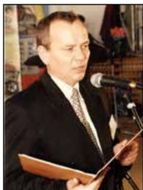
Przygoda mojego życia

Po ukończeniu studiów na Uniwersytecie Wrocławskim w 1973 r. rozpoczęła się moja życiowa przygoda nauczyciela w I Liceum Ogólnokształcącym im. Władysława Broniewskiego w Bolesławcu. Jak się miało okazać, było to moje pierwsze i jedyne miejsce pracy.