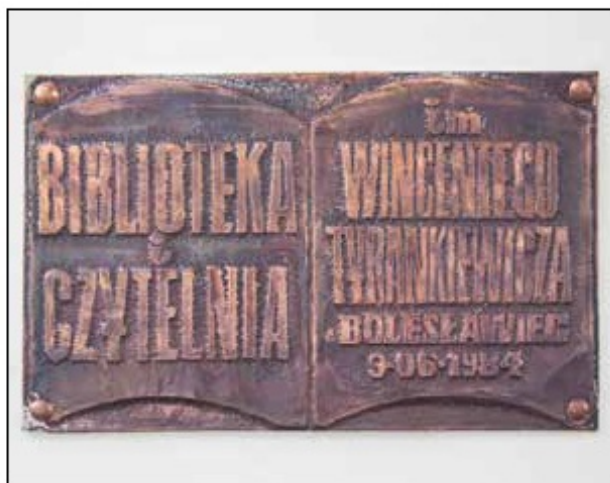
Tablica upamiętniająca nadanie imienia bibliotece szkolnej