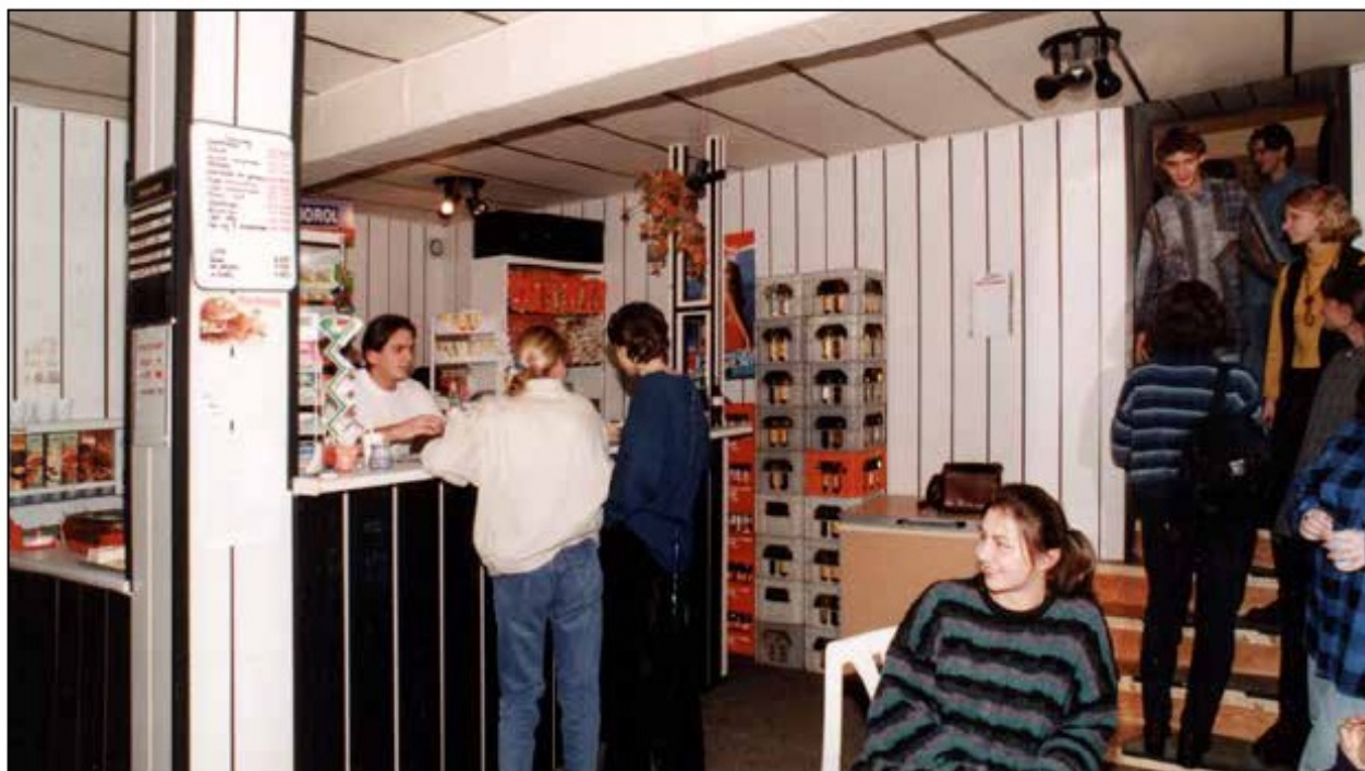
Sklepik szkolny Cujon, 1996 r.