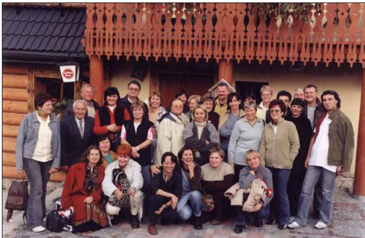
Grono Pedagogiczne i pracownicy administracji, 2007 r.