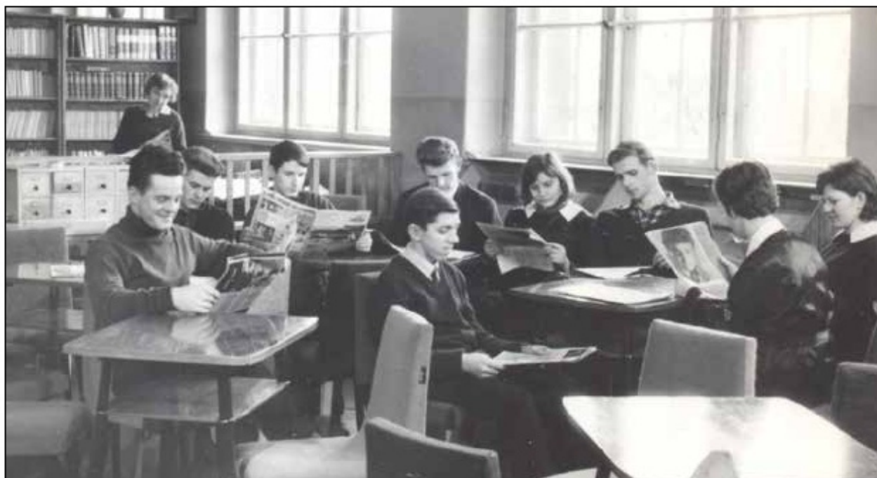
Biblioteka szkolna, l. 60. XX w.