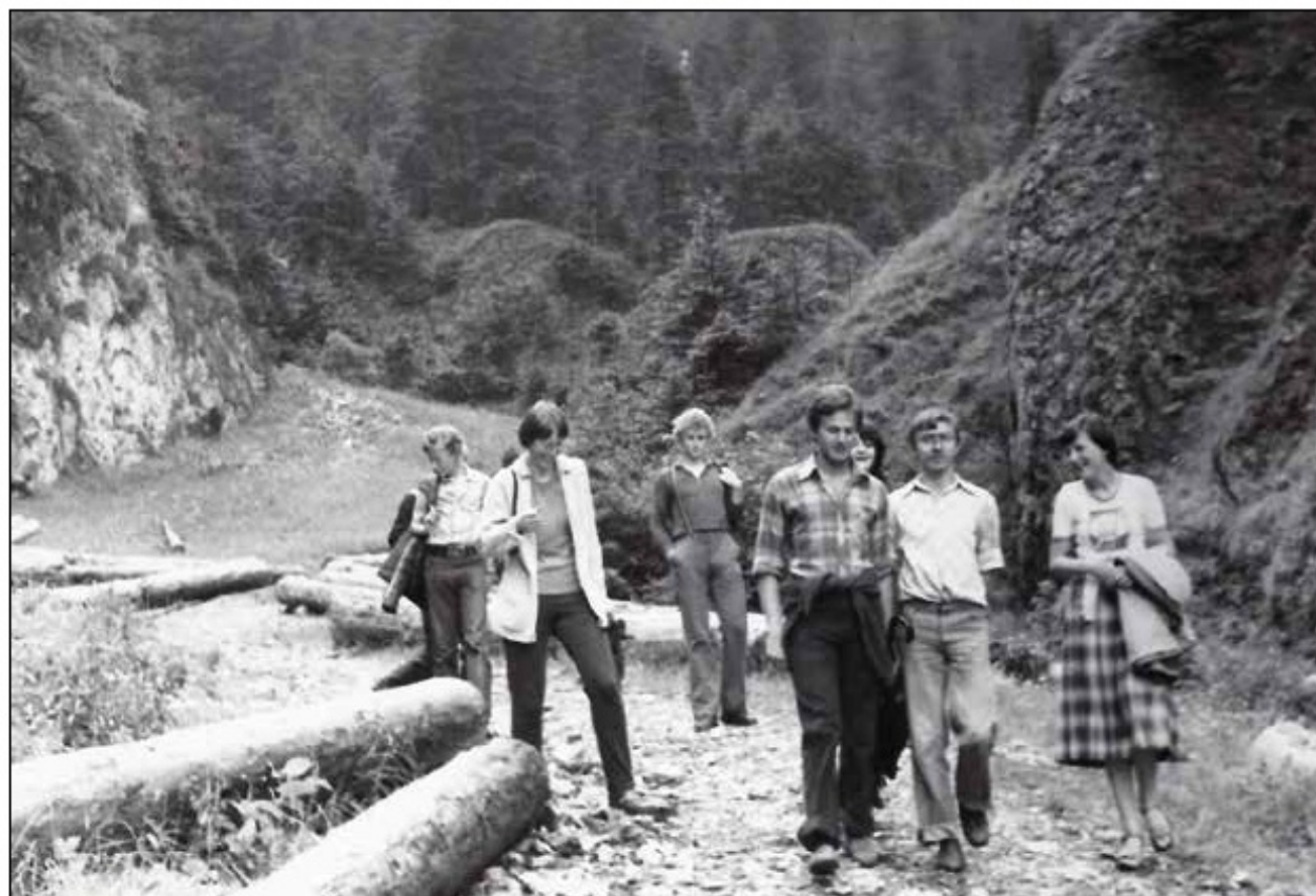
Wycieczka w Tatry, 1979 r.

Wspomnienia tych lekcji, prowadzonych przez znakomite Profesorki, towarzyszyły mi już w dorosłym życiu, kiedy dane mi było spotykać się z Paniami Mrożkiem, Axerem czy prof. Tazbirem oraz wieloma innymi postaciami tak ważnymi dla naszej kultury i literatury. Utrwalałem na zdjęciach wspólnie spędzane z nimi chwile pełne interesujących opowieści i wspomnień.