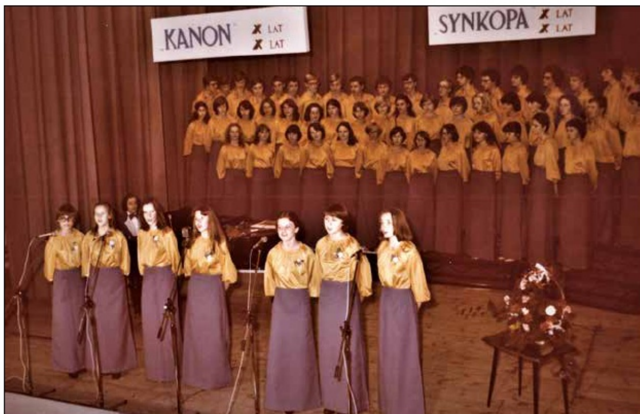
Występ chórów Kanon i Synkopa, podczas uroczystości z okazji jubileuszu powstania, 1977 r.