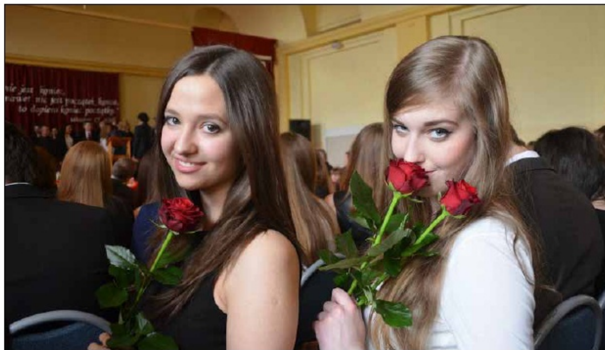
Pożegnanie klas trzecich, 2014 r.

Wszystko to sprawia, że można poczuć się „spad-