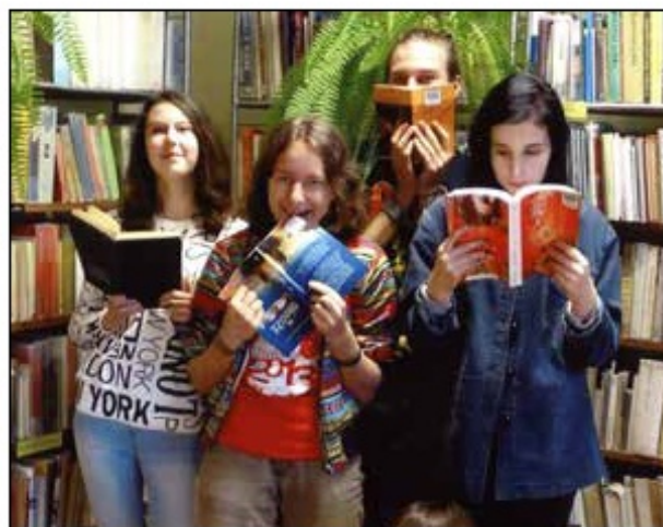
Uczestnicy akcji „Czytam, więc jestem”, 2015 r.