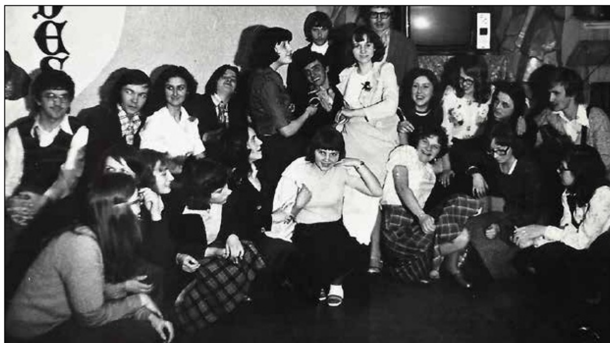
Klasa IV a w klubie szkolnym, 1976 r.