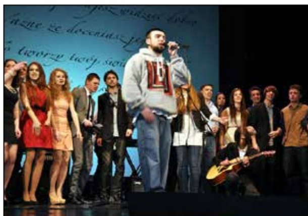
Koncert Walentynkowy, 2013 r.