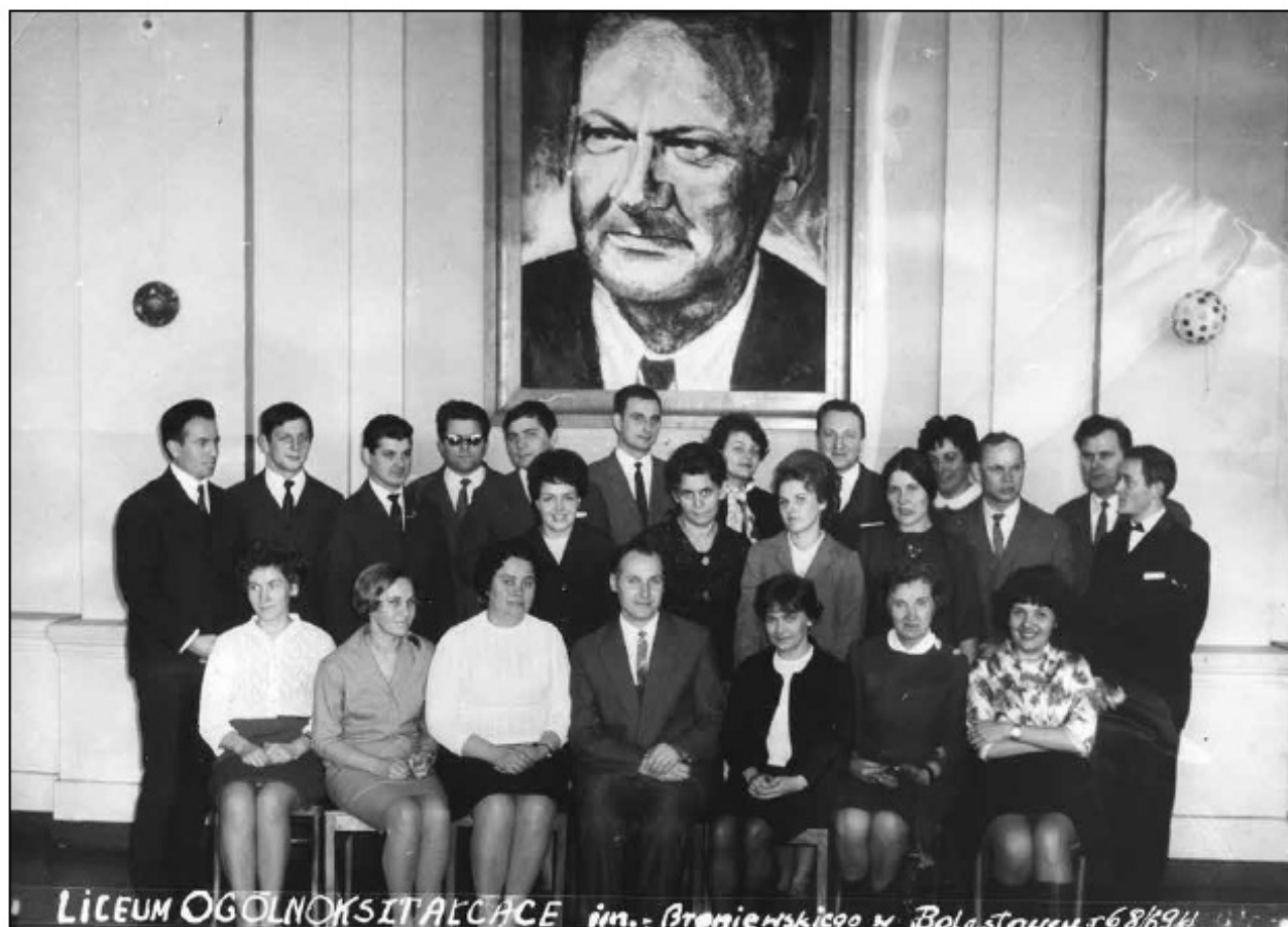
Grono Pedagogiczne 1968/1969

Przez wszystkie lata wzbogacane było wyposażenie szkoły i dokonywane remonty budynku szkolnego. Kapitałny remont przeprowadzony został w latach 1979-1984. Wymieniono wtedy instalację elektryczną i centralne ogrzewanie (łącznie z budową przyłącza do sieci ciepłowni miejskiej), przebudowano pomieszczenia piwniczne na stołów-