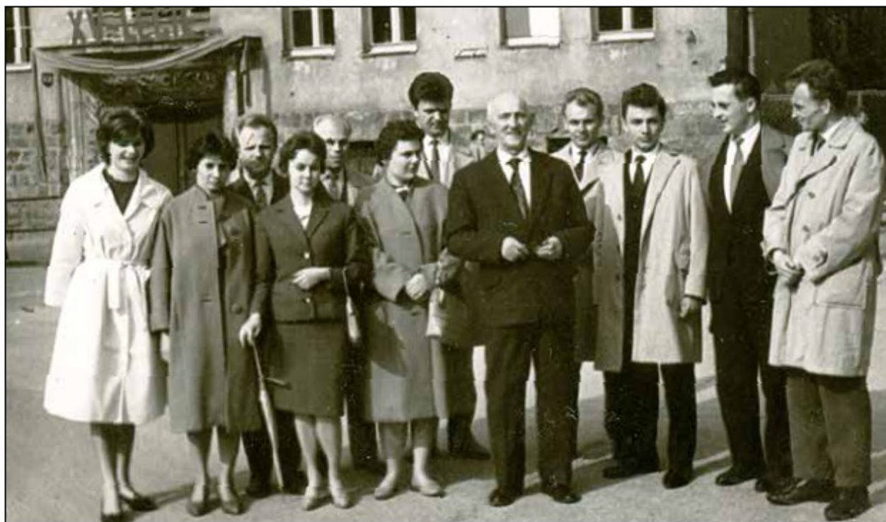
Obchody jubileuszu 15-lecia I LO, 1961 r.