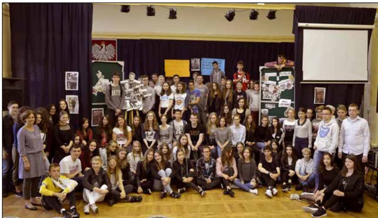
Dzień Humanisty, 2016 r.