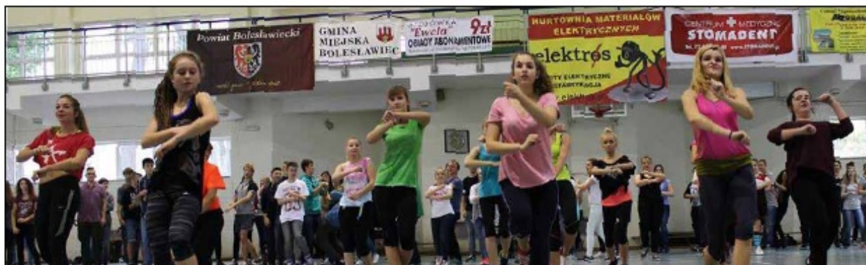
Obchody jubileuszu 15-lecia powstania hali sportowej, 2014 r.