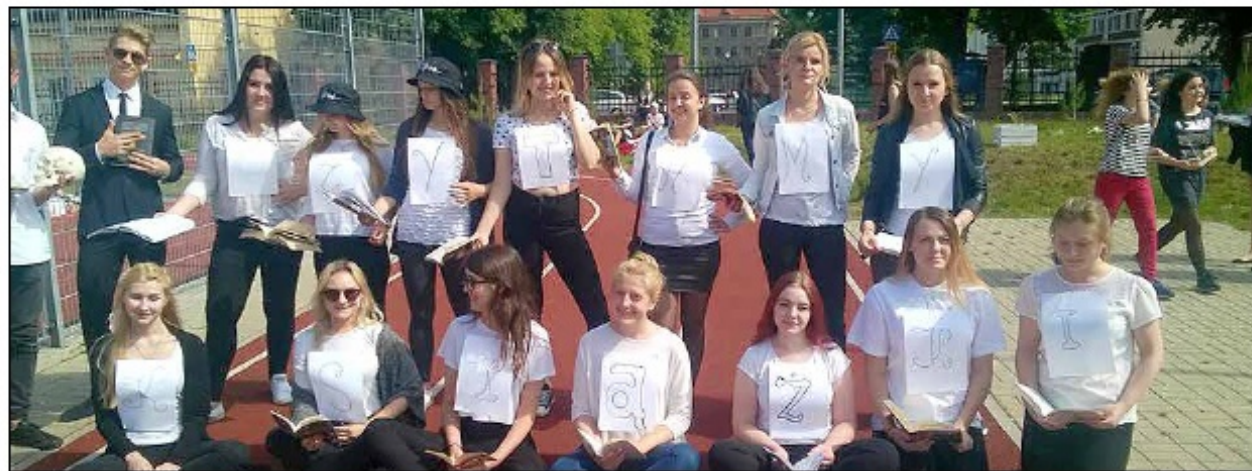
Akcja promująca czytanie książek, 2016 r.