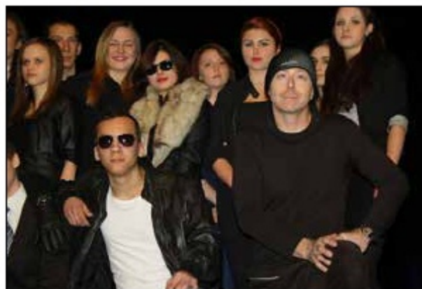
Festiwal Języka Angielskiego, 2012 r.