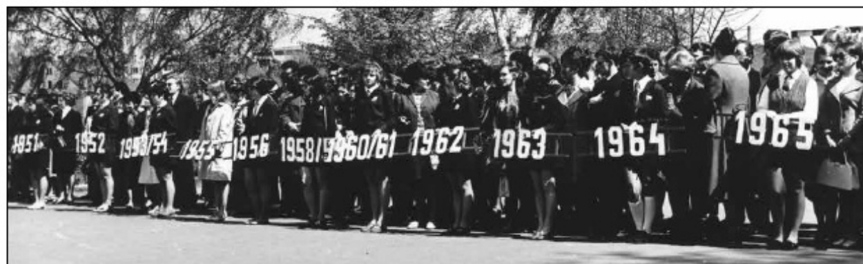
Uczestnicy pochodu absolwentów

Z pewnością, gdyby losy naszych absolwentów przełożył nie tylko na wykaz liczbowy, podporządkowany wyborom uczelni i kierunków studiów, ale także nanieść je na mapę Polski, Europy czy nawet świata - uzupełniłoby to obraz o nowe i ciekawe wnioski. 70 lat szkoły to przecież tysiące życiorysów, często także wspaniałych karier naukowych, artystycznych, sportowych czy społecznych. To rozsiani po całym świecie absolwenci, których łączą wspomnienia z czasów licealnej edukacji. To także obecne grono pedagogiczne, które w około 95% stanowią byli uczniowie I Liceum Ogólnokształcącego.