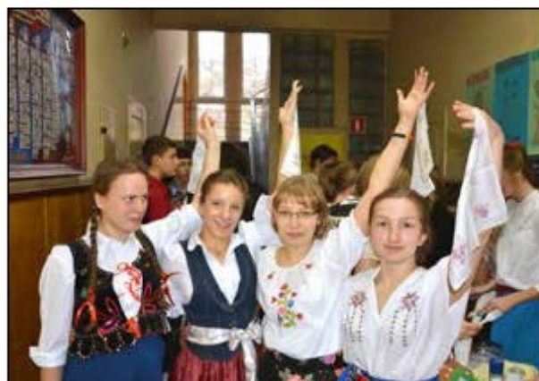
Dzień Języków Obcych, 2013 r.