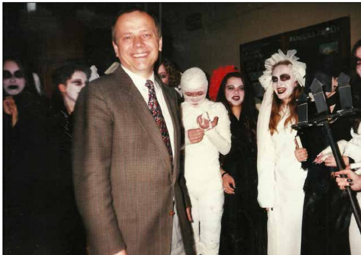
Dzień Samorządu Uczniowskiego, marzec 1997 r.

Wielokrotnie byłem odznaczany i nagradzany - m.in. Złotym Krzyżem Zasługi, Medalem Komisji Edukacji Narodowej, dwukrotnie Nagrodą Ministra Edukacji i trzykrotnie Zarządu Towarzystwa Szkół Twórczych. Odznaczenia te i nagrody stanowią efekt wspólnej pracy Koleżanek i Kolegów pedagogów. Dziękuję wszystkim współpracownikom, których los postawił na mojej drodze życia zawodowego i zapewniam o wdzięczności i pamięci. Jestem dumny również z tego, że absolwentami tak dobrej szkoły są moje dzieci - mam nadzieję - będą nimi również moje wnuki.