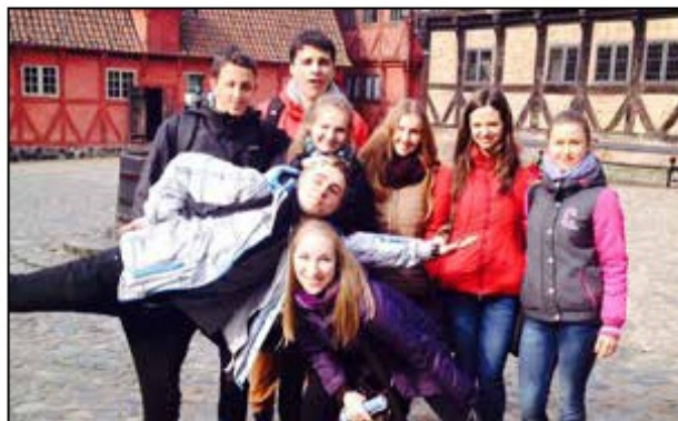
Uczestnicy projektu Comenius, 2014 r.