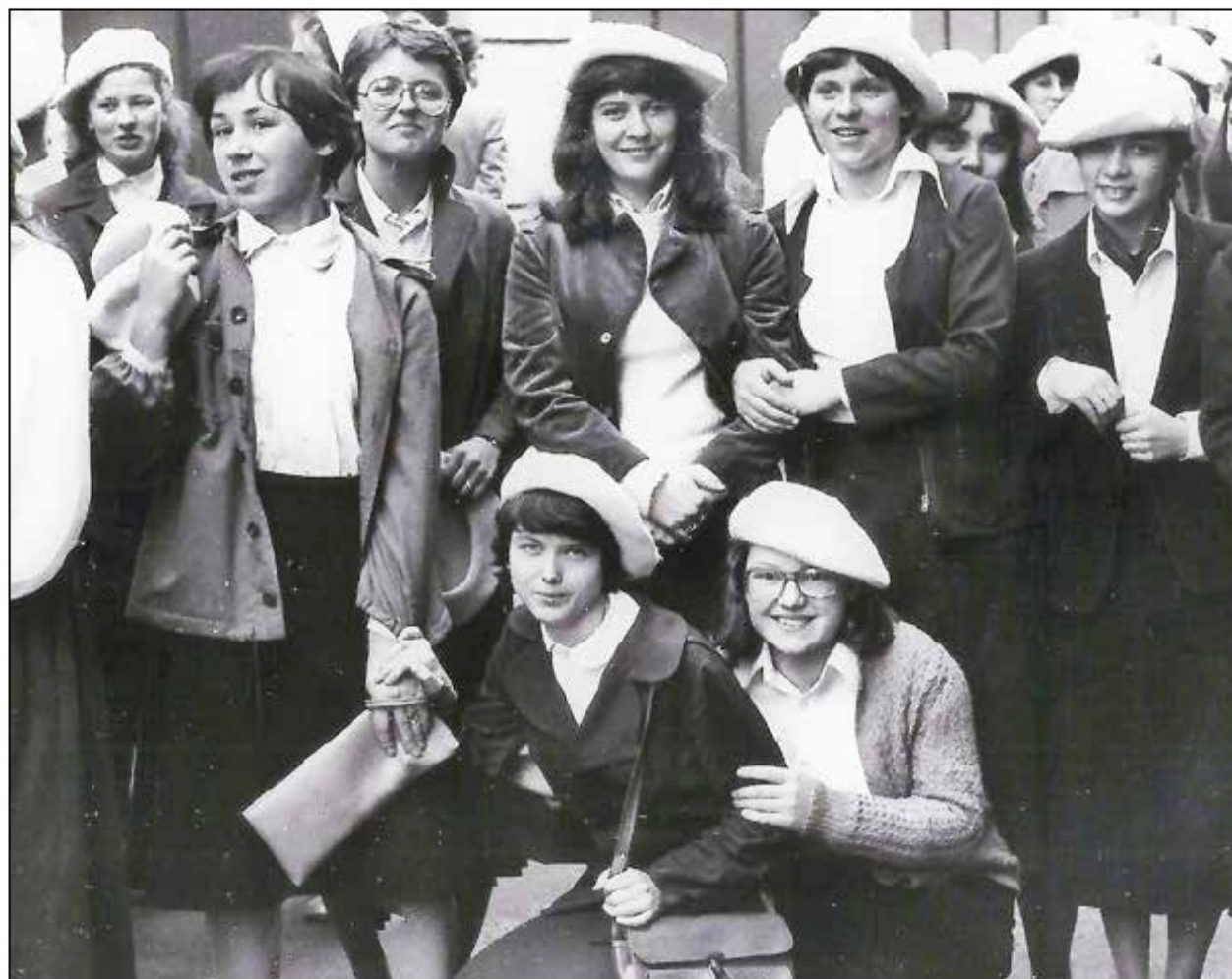
Święto 1. Maja, kl. III b, III e, III a, 1979 r.