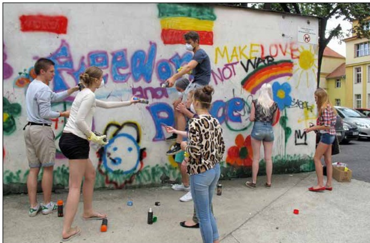
Działania artystyczne uczestników wymiany rodzinnej z Siegburkiem (Niemcy) przed budynkiem I LO w Bolesławcu, 2011 r.

„Wśród licznych i niezwykle wartościowych wrażeń, których mogliśmy doświadczyć dzięki tej wymianie, na szczególne podkreślenie zasługują: nadzwyczajna gościnność Polaków i ukazujące kulturę tego kraju wycieczki. Prowadziły one nas nie tylko do Wrocławia i w Karkonosze - co byłoby wystarczającą atrakcją, ale także do Jeleniej Góry, klasztoru w Lubiążu, do Świdnicy, Krzyżowej, Jawora,