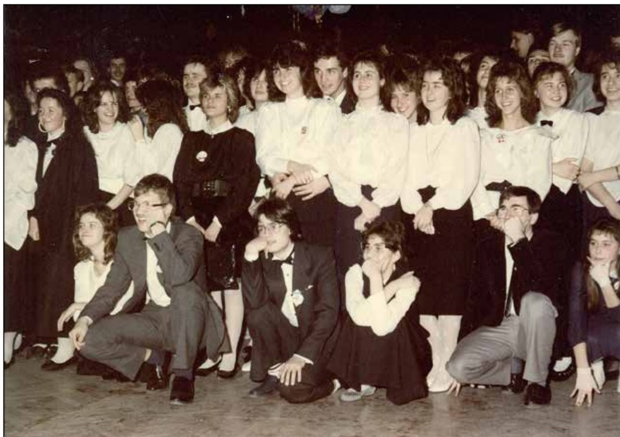
Studniówka 1989 r. klasa IV c