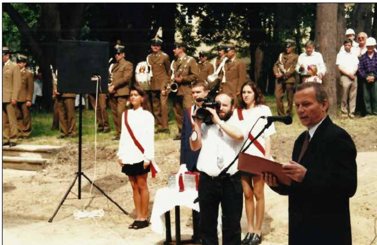
Poświęcenie kamienia węgielnego pod budowę hali sportowej, czerwiec 1997 r.