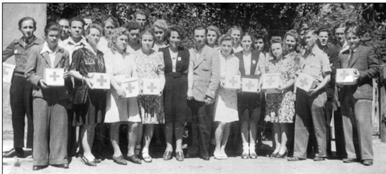
Lata 50. XX w. – pierwsze roczniki na akcji Czerwonego Krzyża, fot. A. Skorupa

W 1966 r. w związku z reformą systemu szkolnego w Polsce (wprowadzenie ośmioklasowej szkoły podstawowej) nie było naboru do klas ósmych, a od początku roku szkolnego 1967/1968 zreformowane Liceum Ogólnokształcące prowadziło kształcenie w zakresie klas I-IV na podbudowie ośmioletniej szkoły podstawowej. Konsekwencją reformy szkolnej z 1999 r., która wydłużyła przedlicealne kształcenie do 9 lat (poprzez wprowadzenie 6-letniej szkoły podstawowej i 3-letniego gimnazjum), było niedokonywanie naboru w 2001 r. i prowadzenie od 2002 r. kształcenia licealnego w zakresie klas I-III na podbu-