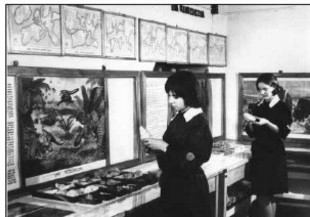
Pracownia geograficzna, l. 60. XX w.