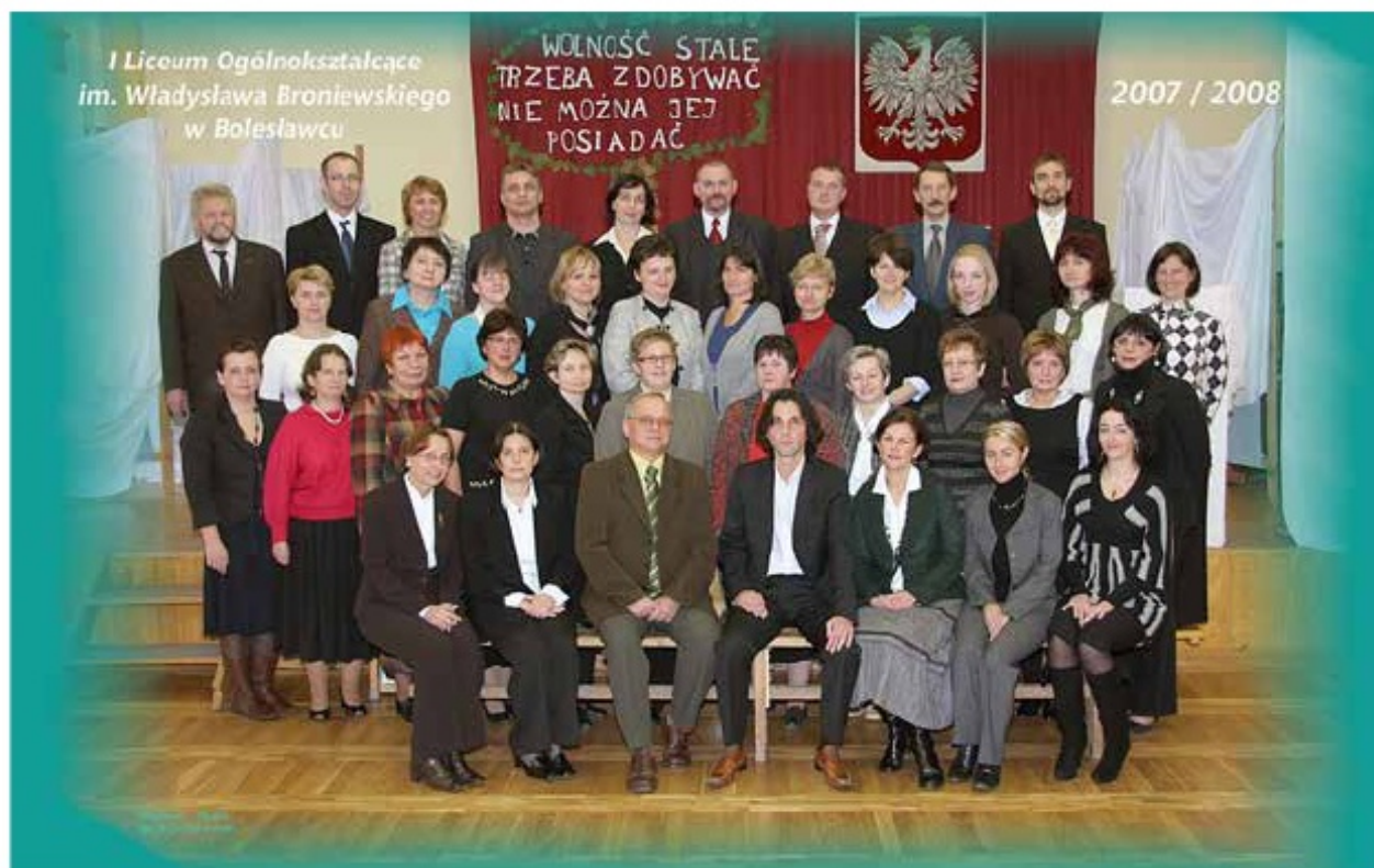
Grono Pedagogiczne 2007/2008