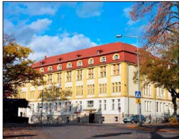
Szkoła, widok współczesny

kę szkolną, położono parkiet i marmurową posadzkę na parterze, zamontowano boazerie na ścianach korytarzy, wykonano nowe pokrycie dachu. Największą inwestycją, którą próbowano podjąć przez kilkadziesiąt lat, było wybudowanie hali sportowej - uroczyste otwartej w 1999 r. W 2001 r. szkoła otrzymała - jako pierwsza w Bolesławcu - pracownię komputerową, gdzie stworzono multimedialne centrum informacji w ramach programu „Pracownie