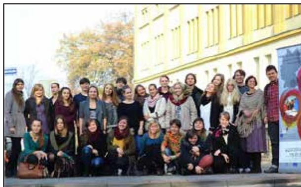
Uczniowie działający w firmie SWAT, 2013 r.