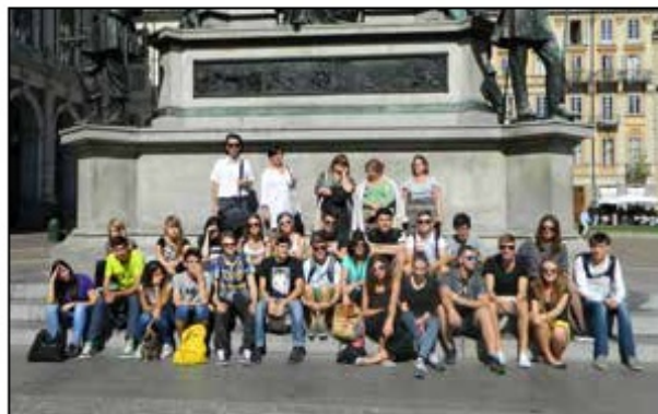
Wizyta w ramach wymiany rodzinnej w Aście (Włochy), 2014 r.