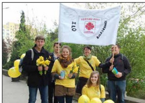
„Pola Nadziei”, zbiórka pieniędzy dla podopiecznych hospicjum, 2014 r.