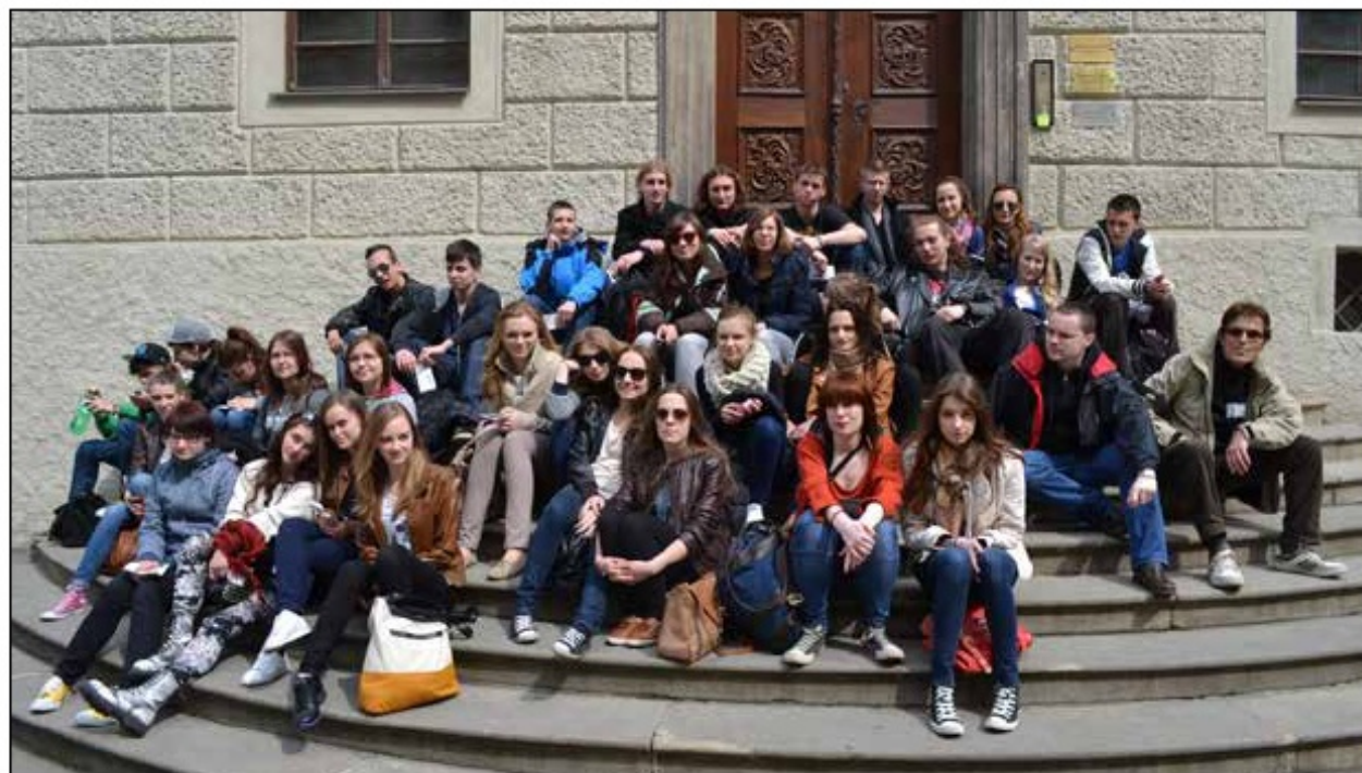
Uczestnicy wycieczki do Pragi, 2012 r.

I tak rozwój naukowy procentował, a działalność na rzecz Uniwersytetu stawała się coraz poważniejsza: zostałam najpierw przedstawicielem studentów w Senackiej Komisji Dydaktycznej, następnie przedstawicielem studenckim Wydziału Filologicznego w Senacie Uniwersytetu Wrocławskiego, potem wiceprzewodniczącą Zarządu Uczelnianego Samorządu Studentów, członkiem Komisji Rewizyjnej Par-