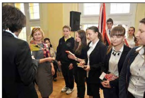
Przyznanie nagród za udział w konkursach i olimpiadach, 2014 r.

liczba uczestników to ponad połowa uczniów. Do etapu centralnego dociera zazwyczaj od 1 do ok. 3% olimpijczyków.