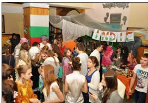
Dzień Języków Obcych