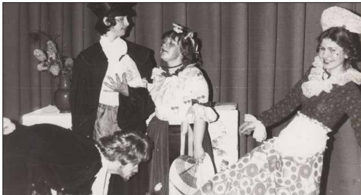
Scena ze spektaklu „Pan Teodor Zrzęda”, Teatr Stary w Bolesławcu, 1976 r.

I LO - wtedy - to naprawdę bardzo dobra szkoła ze znakomitą kadrą pedagogiczną, to miejsce, w którym dużo się działo. Mieliśmy szczęście. Uczyli nas znakomicie wykształceni, doświadczeni, powszech-