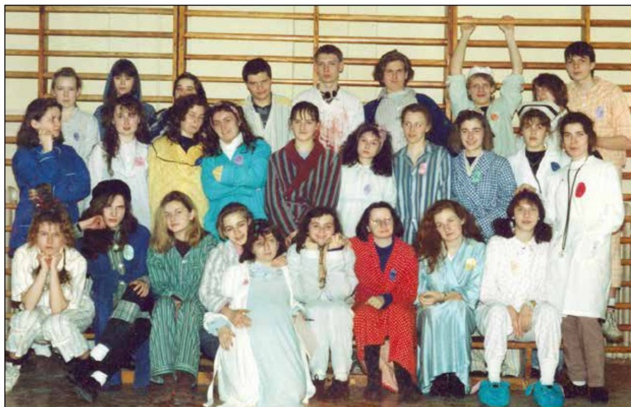
Dzień Wiosny, kl. II B, 1992 r.

*Redakcja przeprasza za ewentualne błędy, które powstały przy tworzeniu listy zarówno w brzmieniu nazwisk, jak i w składzie klas.