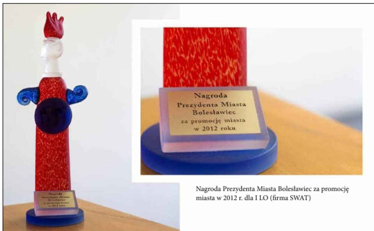
Nagroda Prezydenta Miasta Bolesławiec za promocję miasta w 2012 r. dla I LO (firma SWAT)