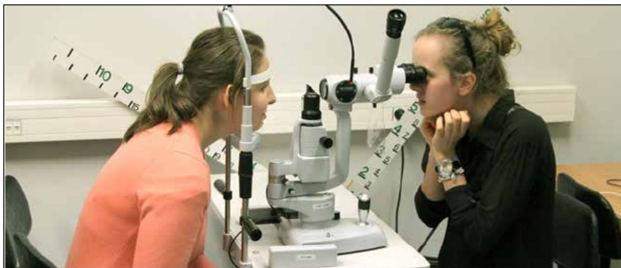
Licealiści podczas warsztatów z optometrii na Politechnice Wrocławskiej, 2013 r.

Zespołu Szkół Twórczych, przekształconego w 1989 r. w Towarzystwo Szkół Twórczych, które w 1996 r. skupiało 32 licea ogólnokształcące z całego kraju. Wspólne działania tych szkół najpierw koncentrowały się na stworzeniu koncepcji pracy z uczniem zdolnym, a później rozszerzono je o inicjatywy usprawniające cały proces dydaktyczno-wychowawczy. W latach 90. XX w., w ramach działalności w Towarzystwie Szkół Twórczych, uczniowie corocznie