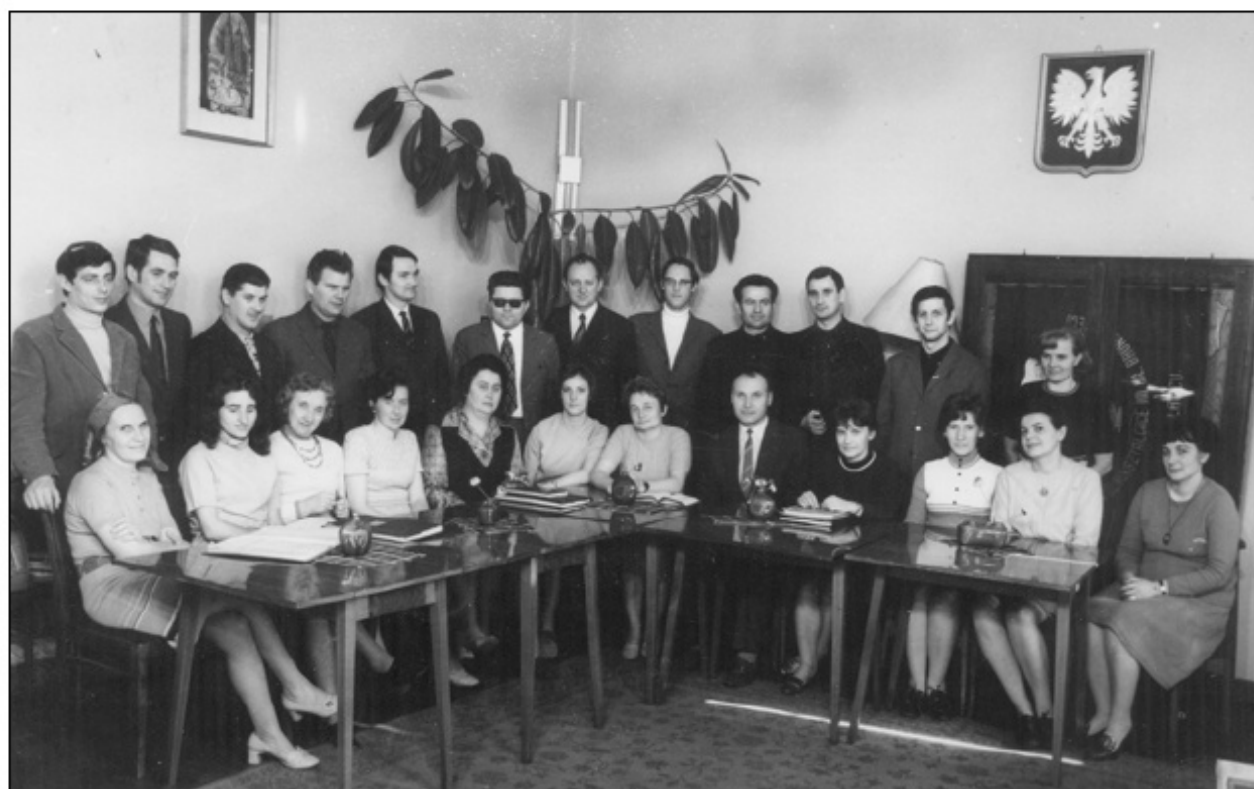
Grono Pedagogiczne 1971/1972