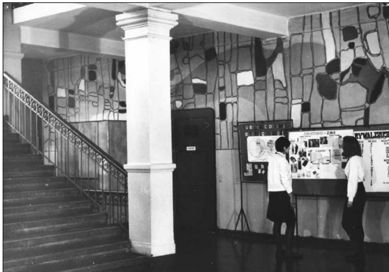
Korytarz na I piętrze, l. 60. XX w.