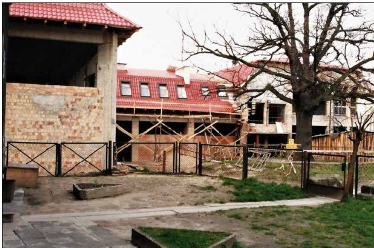
Budowa hali sportowej, 1998 r.