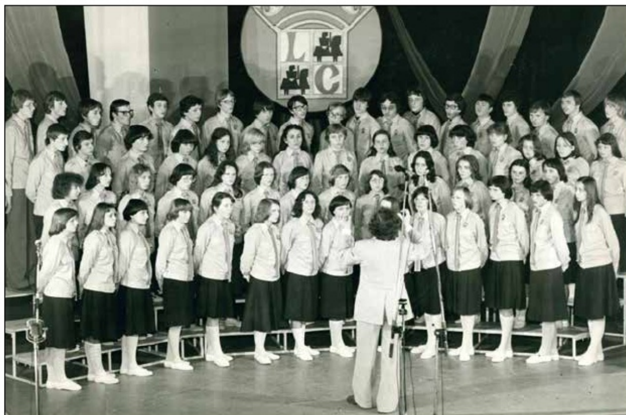
Występ chóru Kanon na festiwalu Legnica Cantat, ok. 1978/1979 r.