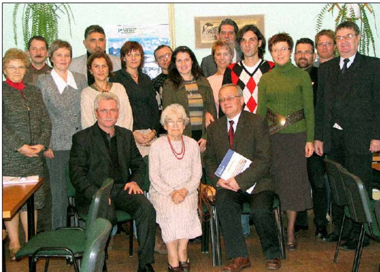
Spotkanie założycielskie Stowarzyszenia na Rzecz Rozwoju I LO, listopad 2006 r.