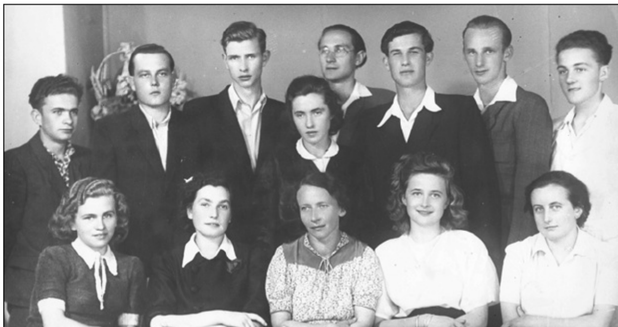
Uczniowie z rocznika 1951

W całej dotychczasowej historii szkoły najwięcej licealistów było w roku szkolnym 1975/1976 - 822 uczniów w 26 oddziałach. W 1977 r. Liceum Ogólnokształcące (noszące od 1962 r. imię Władysława Broniewskiego) zostało połączone z Liceum Ogólnokształcącym dla Pracujących i wieczorowym Średnim Studium Zawodowym o kierunku społeczno-prawnym (istniejącym w latach 1977-1981) w Zespół Szkół Ogólnokształcących. Po powstaniu w 1991 r. II Liceum Ogólnokształcącego im. Janusza Korczaka w Bolesławcu wprowadzono numerację