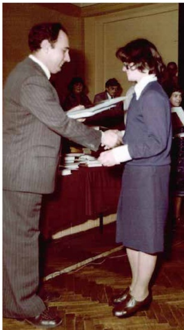
Podsumowanie ruchu olimpijskiego, rok szkolny 1976/1977

To wszystko było możliwe dzięki ogromnemu zaangażowaniu grona pedagogicznego i pracy uczniów, którzy zarówno kiedyś, jak i dziś stanowili największy atut tej szkoły. Jest mi niezwykle miło, że również mi dane było współtworzenie historii tej placówki.