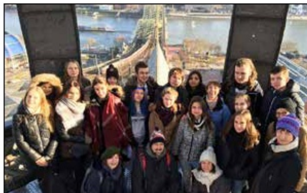
Uczestnicy wymiany uczniowskiej w Siegburgu (Niemcy), 2016 r.

w Krzyżowej. Prywatne osoby gościły uczniów naszej szkoły w czasie wakacji, umożliwiając im doskonale nie języka i pokazując piękno Niemiec.