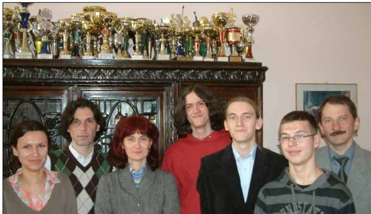
Laureaci olimpiad wraz z opiekunami, 2008 r.

Podobnie jak we wcześniejszych okresach, tak i w ostatnim pięcioleciu młodzież I Liceum chętnie bierze udział w konkursach naukowych. Na etapie szkolnym niemal wszystkich olimpiad i konkursów