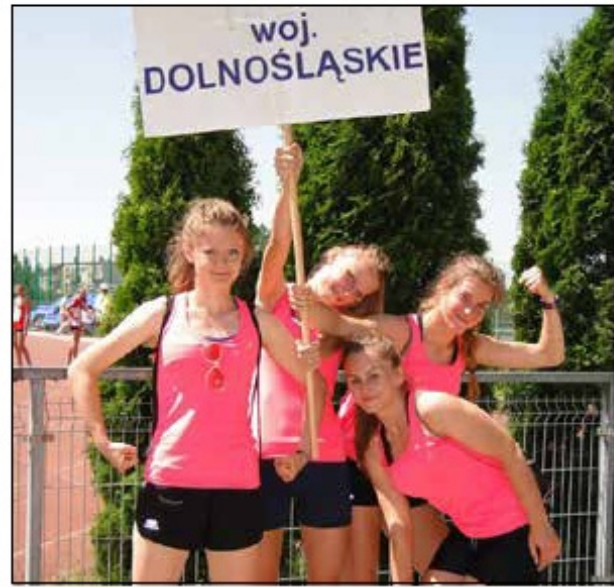
Reprezentacja I LO na Mistrzostwach Polski, 2013 r.

Lekcje wychowania fizycznego odbywały się w dzisiejszych aulach szkolnych, które wtedy szumnie nazywano „dużą i małą salą” oraz w siłowni, która znajdowała się w piwnicy (obok szatni). Pomimo tych trudnych warunków lokalowych młodzież licznie i chętnie uczestniczyła we wszystkich sportowych