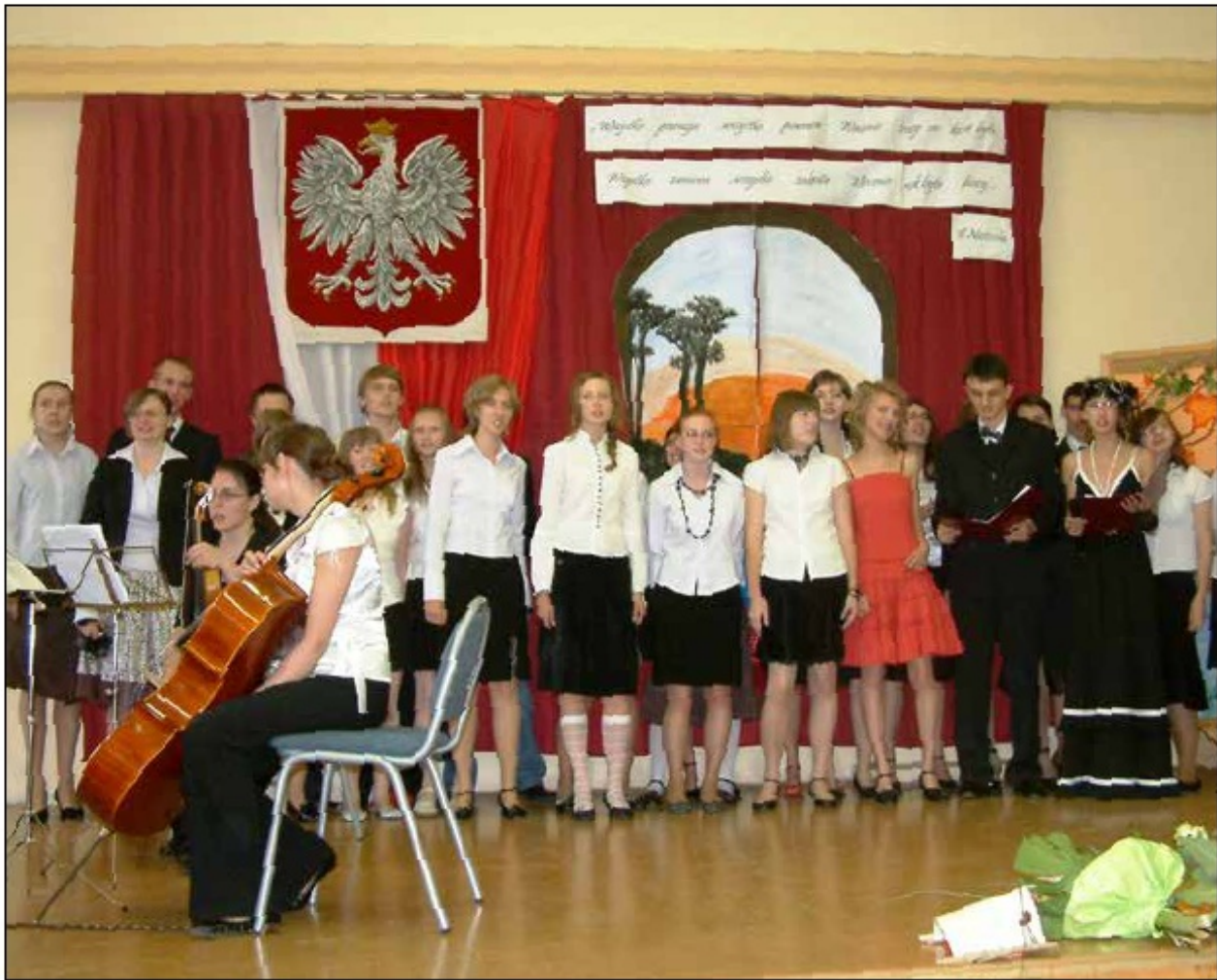
Dzień Edukacji Narodowej, 2007 r.