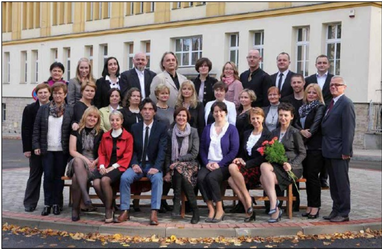
Grono Pedagogiczne, 2013 r.